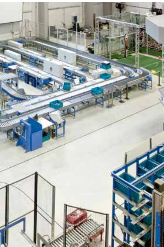
und der TU Dortmund entsteht ein neues Forschungszentrum Logistik.