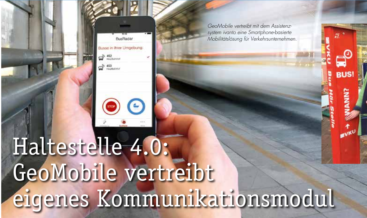
GeoMobile vertreibt mit dem Assistenzsystem ivanto eine Smartphone-basierte Mobilitätslösung für Verkehrsunternehmen.