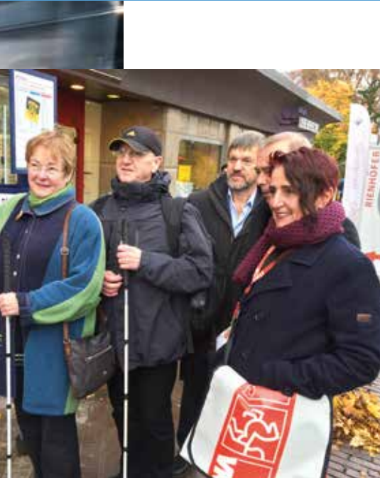
Die smarte Stele an der Haltestelle ist der neueste Baustein in den Inklusionsbemühungen der Verkehrsgesellschaft Kreis Unna. Die „Bus.Hör.Stelle“ ist eine Erweiterung der ivanto Systemlösung der GeoMobile GmbH für Fahrgäste, die ohne Smartphone unterwegs sind.

Die Dortmunder Fachtagung „Smart Energy 2016“ bot am 27. und 28. Oktober unter dem Titel „Digitalisierung der Energieversorgung – Treiber und Getriebene“ ein Forum, um aktuelle Entwicklungen im Energiesektor zu diskutieren. Die Schirmherrschaft hatte NRW-Wissenschaftsministerin Svenja Schulze übernommen. Auf der Tagung ging es um Themen wie Cloud-Computing, Datenschutz, E-Mobility, Lade- und IKT-Infrastruktur. Rund 150 Teilnehmende nutzten die Gelegenheit zum wissenschaftlichen wie auch anwendungsorientierten Gedankenaustausch in der DASA. Veranstalter waren die Fachhochschule Dortmund, die Ruhr Master School of Applied Engineering und die Alcatel-Lucent-Stiftung für Kommunikationsforschung. www.fh-dortmund.de