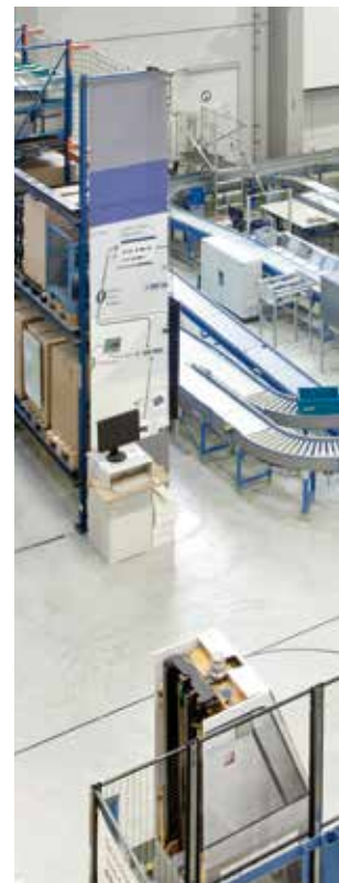
In den Hallen des Fraunhofer IML für hybride Dienstleistungen in der

www.tu-dortmund.de • www.iml.fraunhofer.de