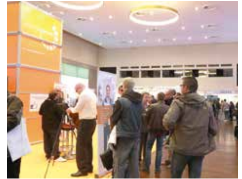
Auch das TZDO war als Aussteller auf der Initiale 2016 vertreten.