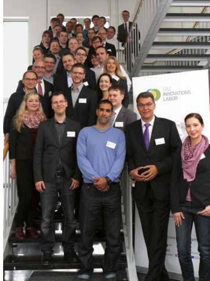
Die Teilnehmer des Innovationslabors besitzen Gründergeist und führen ihre Geschäftsideen gemeinsam mit Partnern aus der Wirtschaft zur Marktreife.