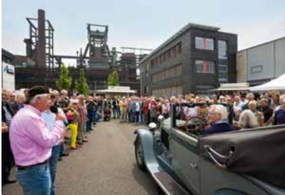
Ausgewählte Oldtimer werden am 29. Juni 2014 auf dem Gelände von ZfP und Albonair präsentiert.