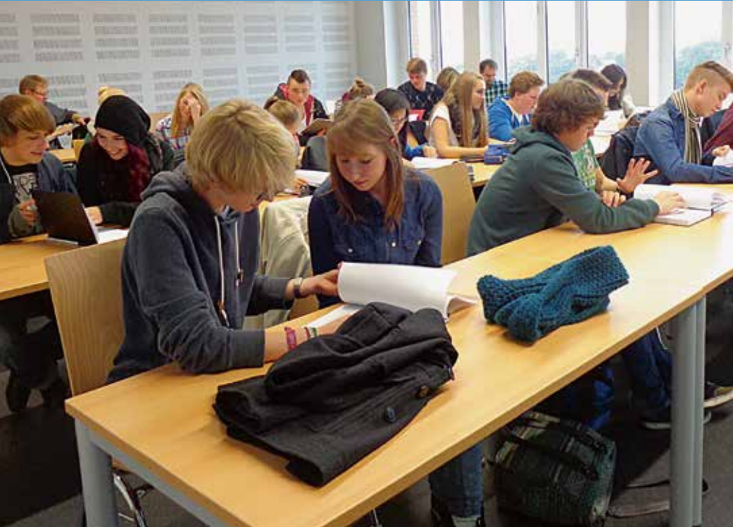
Die Junior Business School will Schülerinnen und Schüler früh für ökonomische Themen sensibilisieren und ihre wirtschaftliche Mündigkeit fördern.