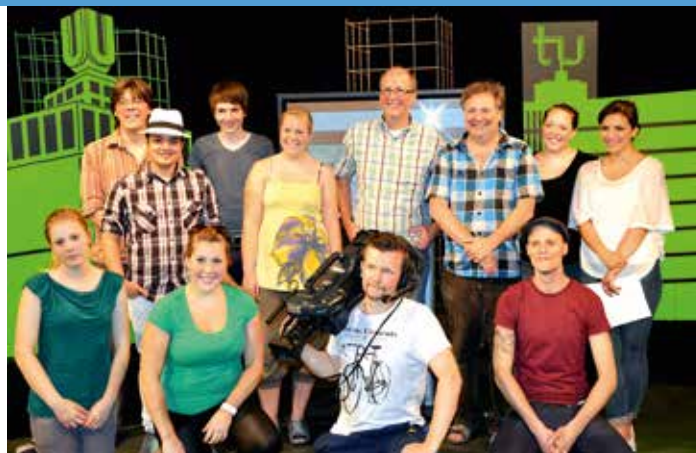
Das Team des tu>startup-Gründungsmagazins „up>geht's“ präsentiert erfolgreiche Dortmunder Gründer mit ihren Geschäftsideen.