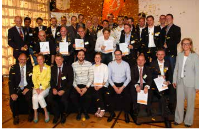
„Goldregen“ für die start2grow-Sieger 2014: Die Organisatoren und Beteiligten freuen sich mit den Gewinnern des bundesweiten Gründungswettbewerbs über die ausgezeichneten Geschäftsideen.