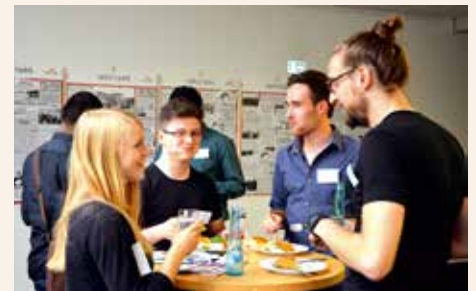
Gute Laune und leckeres Essen gab es für die Gründerinnen und Gründer beim Auftakt der vierten Runde der tu>startup CLIQUEN im TZDO abendrauf.

Der Startschuss für die vierte Runde der tu>startup CLIQUEN am 18. September im TechnologieZentrumDortmund (TZDO) hat erneut unterschiedlichste Gründungsideen und Wege der Problemlösung zu Tage befördert. Bei den folgenden vier Treffen im TZDO werden durch das spannende Tool „Business Model Canvas“, bohrende Experten und gegenseitiges Pitchen Gehirnknoten gelöst, Sackgassen entlarvt sowie Stärken und Schwächen aufgespürt. Das kostenlose Angebot richtet sich an unternehmerisch interessierte Studierende der Hochschulen aus Dortmund und der Region. www.tu-startup.de